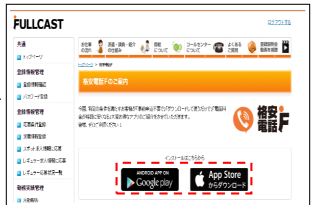
(「キャストポータル」でも告知開始)

フルキャストは、今後も登録スタッフの要望や意見を反映させて、サービスインフラの利便性や福利厚生サービスの拡充、また、積極的な外部サービスとの連携により、満足度の高いサービスの提供を目指していきます。