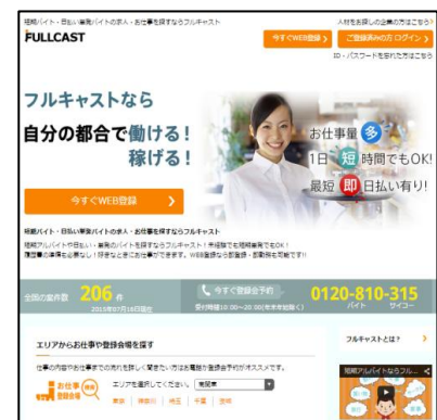
ポータルサイト TOP ページイメージ